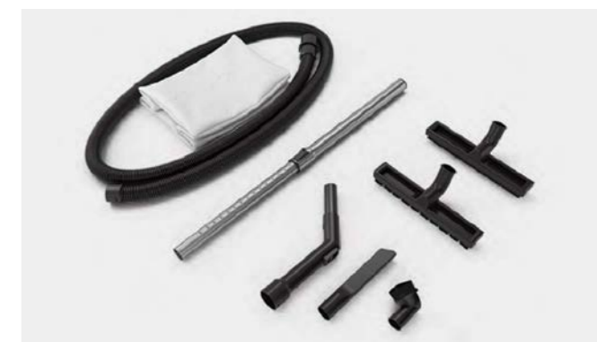
Der Sauger ist standardmäßig mit viel Zubehör ausgestattet.