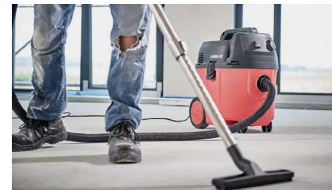
Dank 35 Liter Behältervolumen ist der VC 760 sehr ausdauernd.