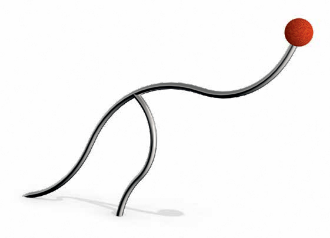
Skizze 1: Gesamtansicht des Spielgerätes