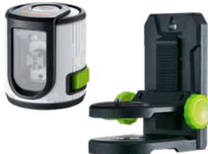
EasyCross-Laser Green Set + Stativ- / Wandhalterung + Batterien

Verpackungsgröße (B x H x T) 135 x 320 x 200 mm